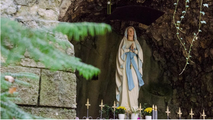
Fernwanderweg - Meditationsweg, erste Etappe - Die Lourdesgrotte - © Das Blaue Land / Simon Bauer