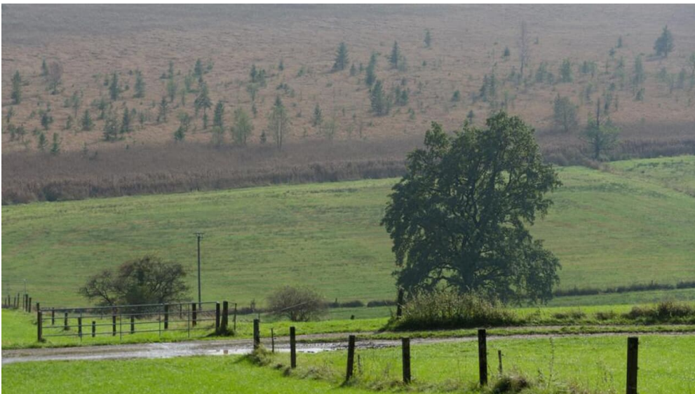
Fernwanderweg - Meditationsweg, erste Etappe - Murnauer Moos