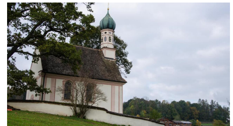
Fernwanderweg - Meditationsweg, erste Etappe - Das Ramsackkirchle!