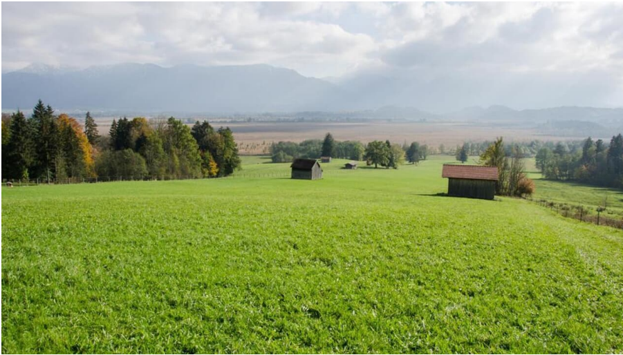
Fernwanderweg - Meditationsweg, erste Etappe - Blick auf das Murnauer Moos