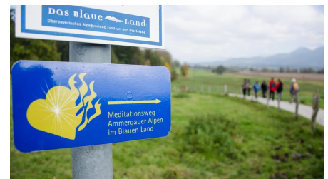
Fernwanderweg - Meditationsweg, erste Etappe - Unterwegs auf dem Meditationsweg