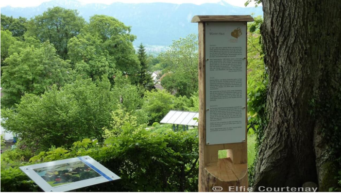
Fernwanderweg - Meditationsweg, 2. Etappe - Stele am Münterhaus