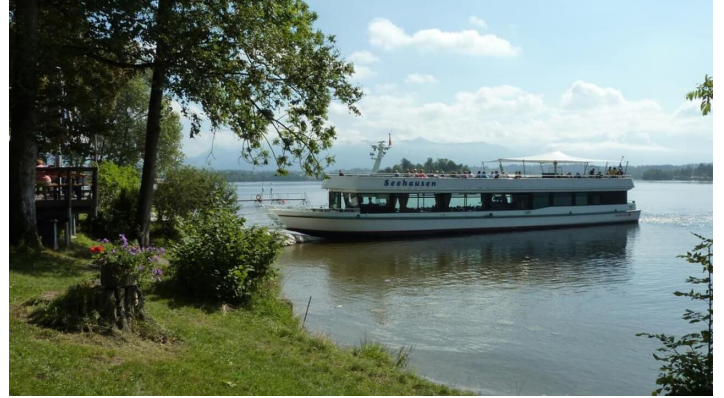
Fernwanderweg - Meditationsweg, 2. Etappe - Anlegestelle am Staffelsee