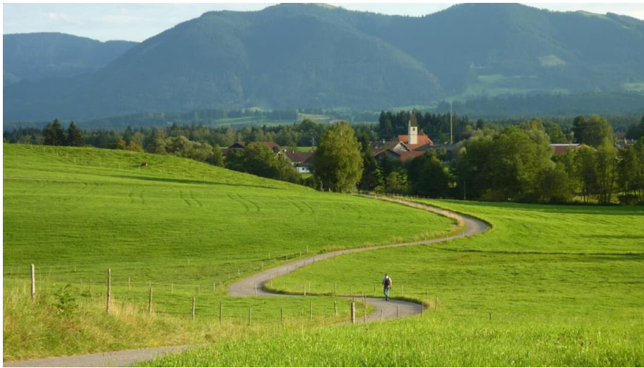
Fernwanderweg - Meditationsweg, 2. Etappe - Blick Richtung Schöffau - © Elfie Courtenay