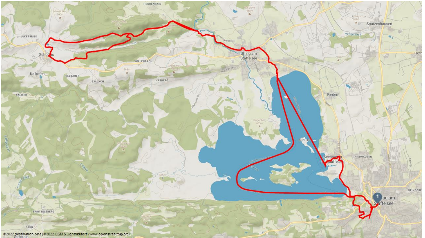
©2022 destination one | ©2022 OSM & Contributors (www.openstreetmap.org)