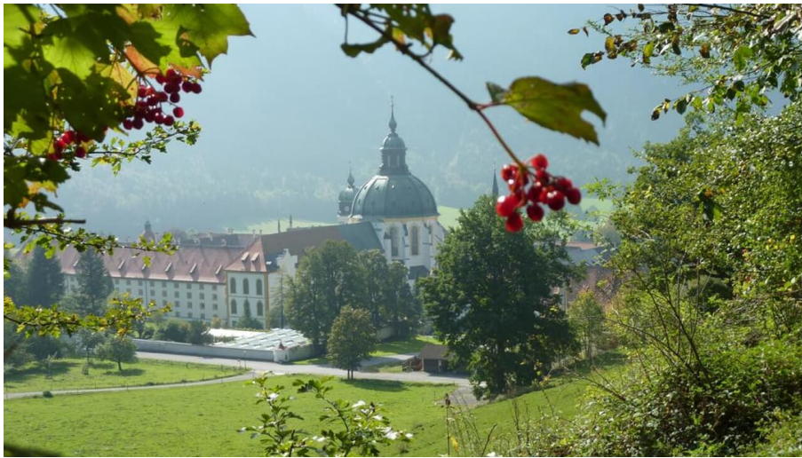
Fernwanderweg - Meditationsweg, 6. Etappe - Blick auf Kloster Ettal