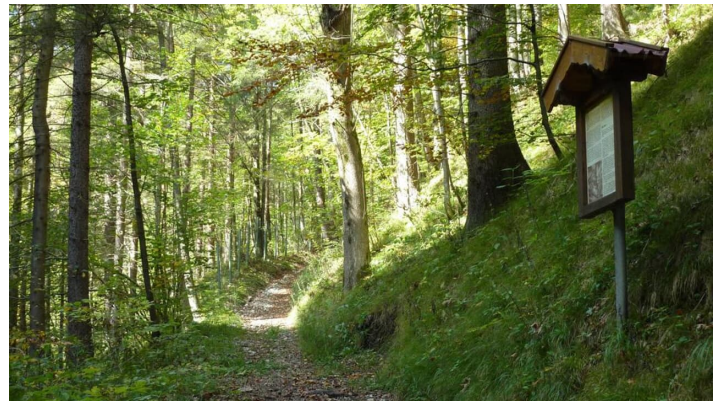
Fernwanderweg - Meditationsweg, 6. Etappe - Alte Kienbergstraße - © Elfie Courtenay