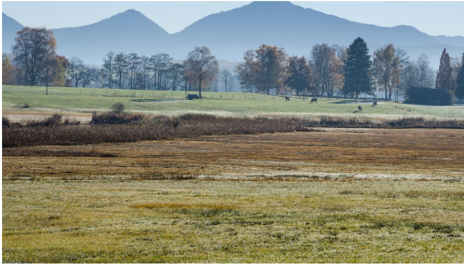
Wanderung - Kirnberg-Rundweg - Blick in die Alpen