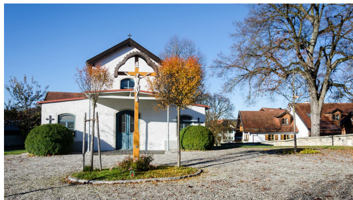
Wanderung - Tafertshofen Rundweg - Ortsidylle in Uffing - © Das Blaue Land / Simon Bauer