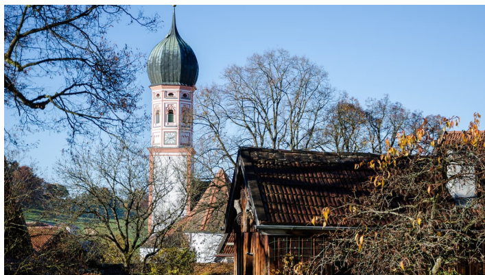
Wanderung - Tafertshofen Rundweg - Uffing am Staffelsee

Unterkunft im Blauen Land finden Prospekte bestellen