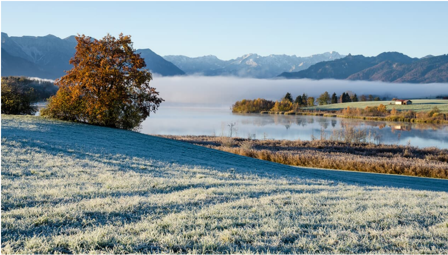
Wanderung - Höhlmühle-Rundweg - Blick auf den Riegsee