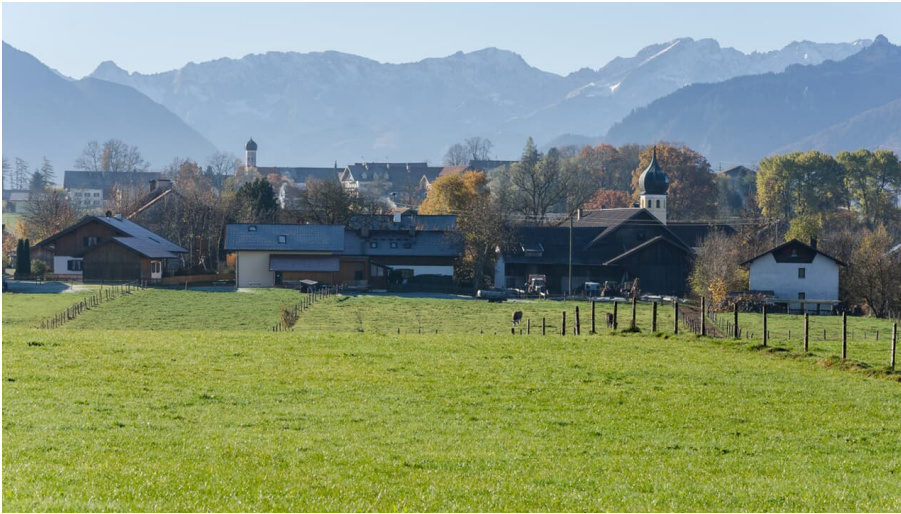
Wanderung - Hungerbach-Rundweg - Spatzenhäuser mit Alpen - © Das Blaue Land / Simon Bauer