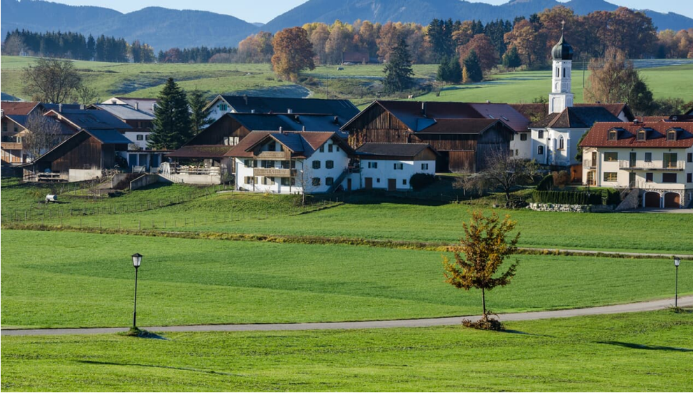
Wanderung - Hungerbach-Rundweg - Egging mit Alpenpanorama