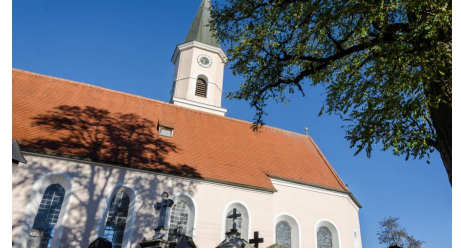
Wanderung - Hungerbach-Rundweg - Kirche in Egging