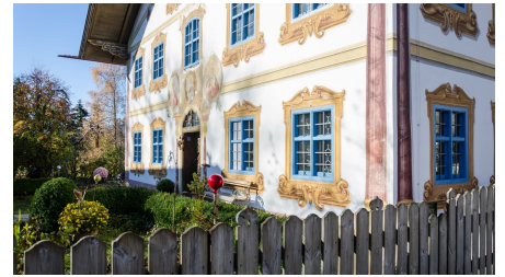
Wanderung - Hungerbach-Rundweg - Der Freskenhof in Egging