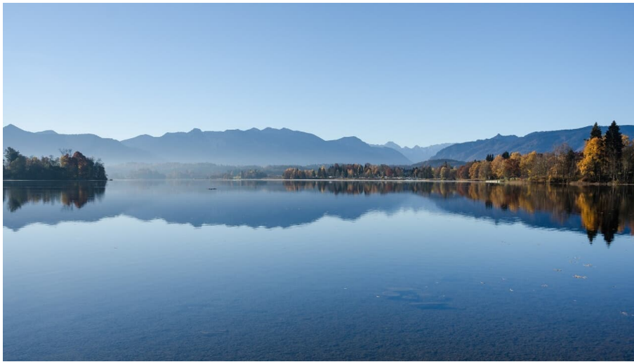
Radtour - Blaues Land - Blick auf den Staffelsee - © Das Blaue Land / Simon Bauer