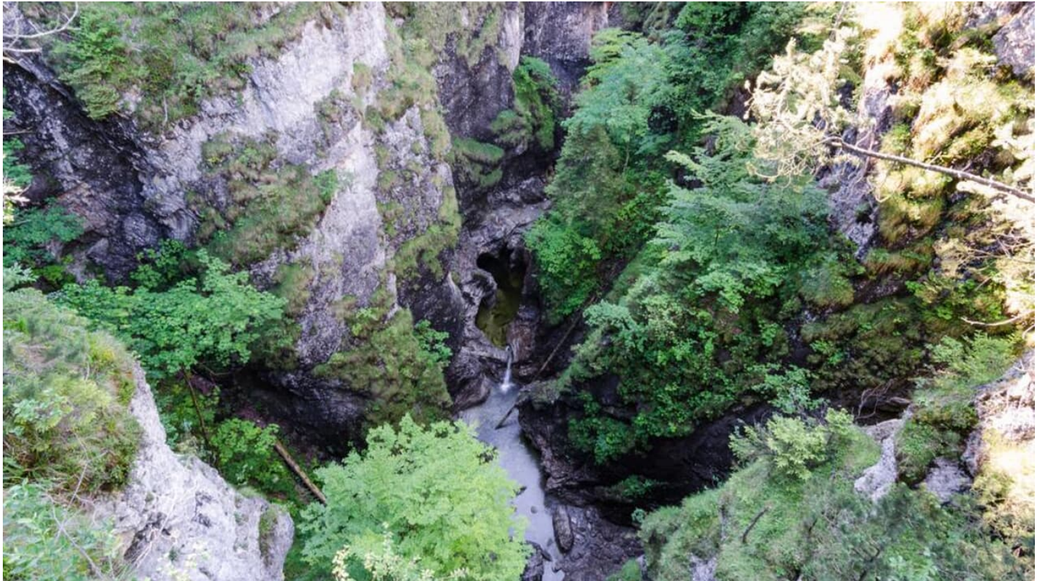
Mountainbiketour - Ins Eschenlainetal - Die Asamklamm