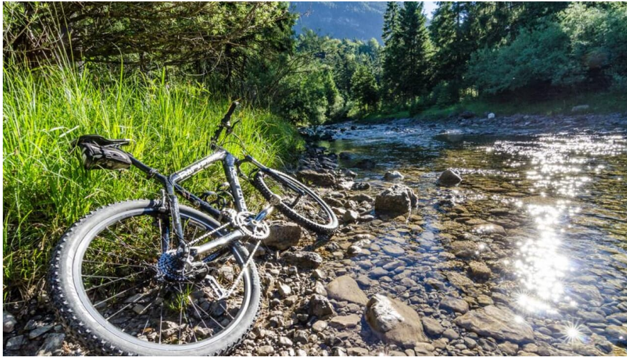
Mountainbiketour - Ins Eschenlainetal - An der Eschenlaine - © Das Blaue Land / Simon Bauer