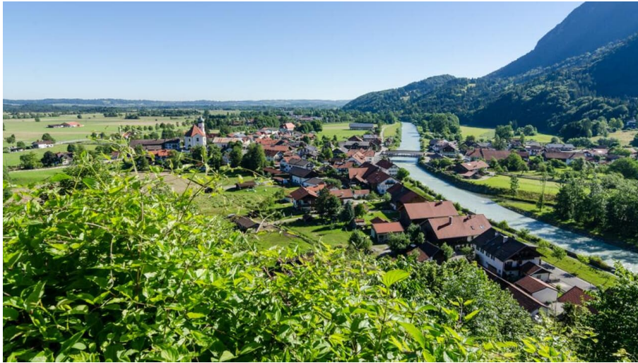
Fernradweg - Bodensee-Königssee-Radweg - Blick von Eschenlohe ins Blaue Land