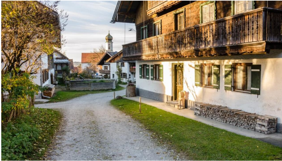
Fernradweg - Loisach-Radweg - Ortszentrum von Ohlstadt