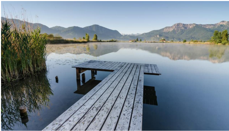
Radtour - Das Blaue Land - Der Eichsee bei Großweil