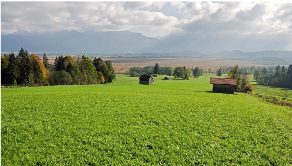
Fernwanderweg Meditationsweg - Blick ins Murnauer Moos