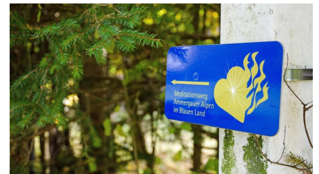
Fernwanderweg Meditationsweg - Auf dem Meditationsweg