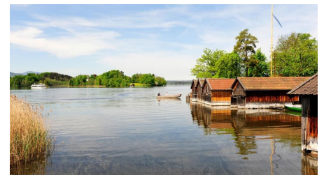
Fernwanderweg Meditationsweg - Blick auf den Staffelsee