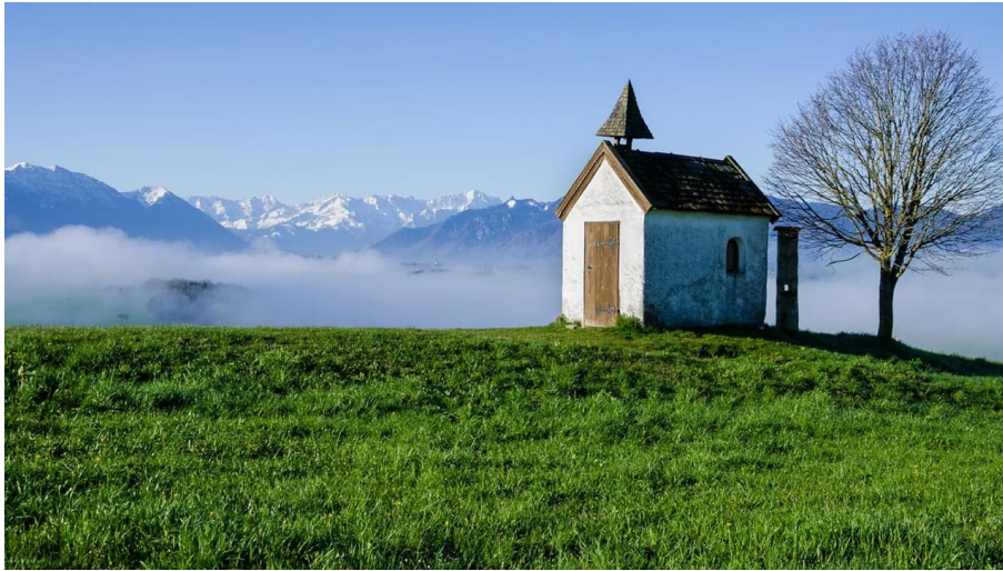
Fernwanderweg Meditationsweg - Die Aidlinger Kapelle