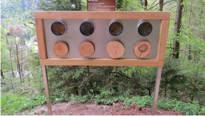
Bergwallerlebnispfad Ettal - Baumarten