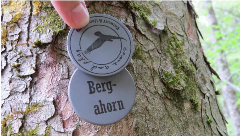
Bergwalderlebnispfad Ettal - Baumarten

Prospektmaterial ansehen und/oder bestellen