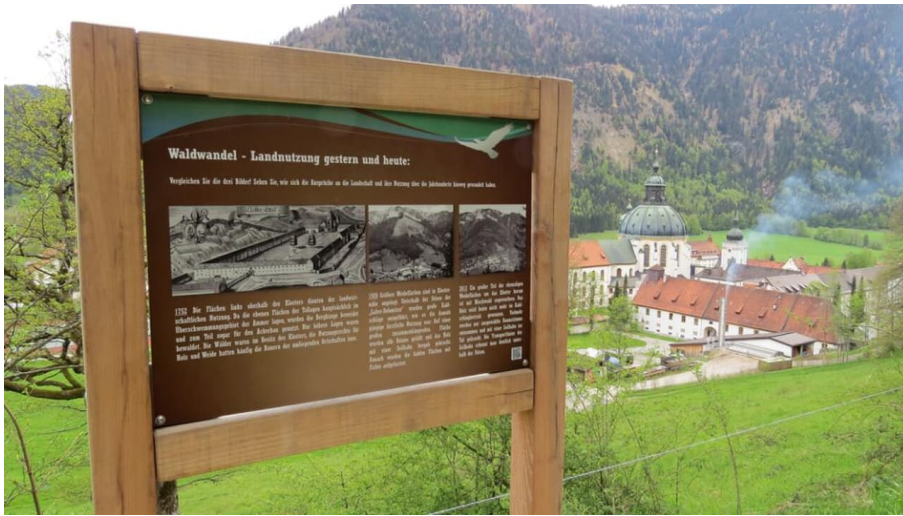
Bergwallerlebnispfad Ettal - © Thorsten Unsel, Michael Gonschorek