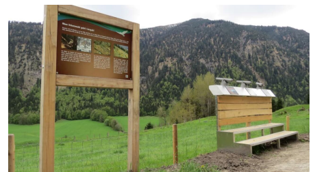
Bergwalderlebnispfad Ettal