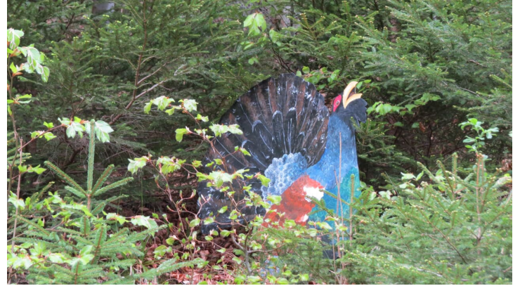
Bergwallerlebnispfad Ettal - Tierarten