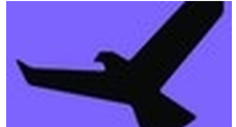
Signet Bergwalderlebnispfad - © Arvis Robalds, Naturpark Ammergauer Alpen