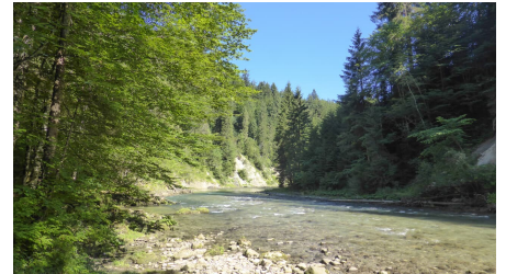
Ammer zwischen Bad Bayerstein und dem Kraftwerk Kammerl