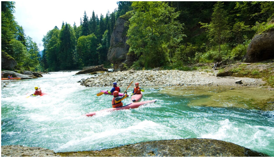
An der Scheibum