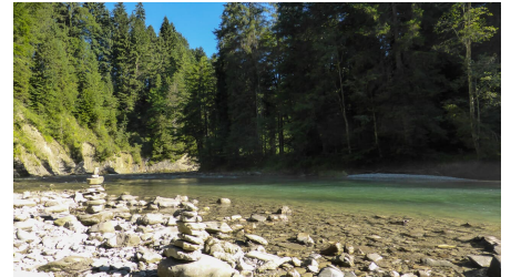
Ammer zwischen Bad Bayerstein und dem Kraftwerk Kammerl