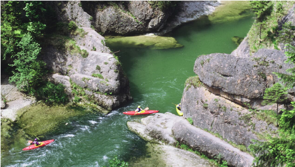
An der Scheibum

Prospektmaterial ansehen und/oder bestellen