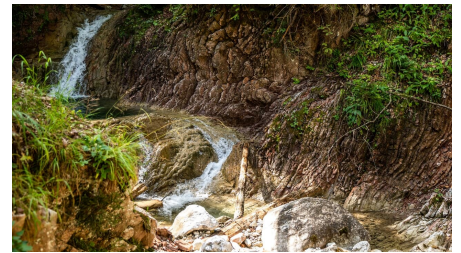
In der Schleifmühlklamm