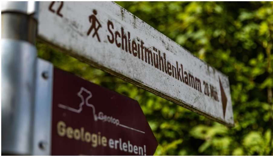
Zur Schleifmühlklamm - © Erika Spengler, Zugspitz Region GmbH