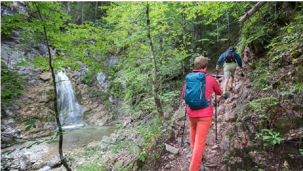
Wandern durch die Schleifmühlklamm in Unterammergau - © Thomas Bichler, Ammergauer Alpen GmbH