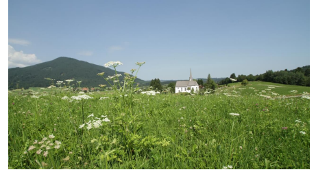
Wanderung - Hörnle-Alm