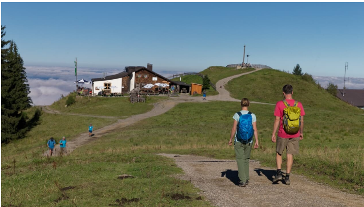
Wanderer an der Hörnle Hütte