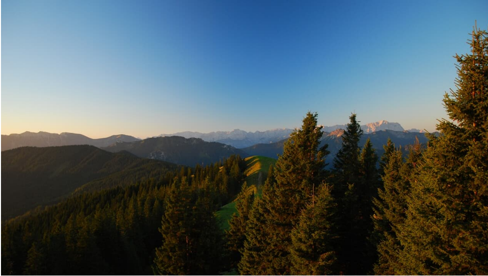
Blick vom hinteren Hörnlegipfel auf den Stierkopf