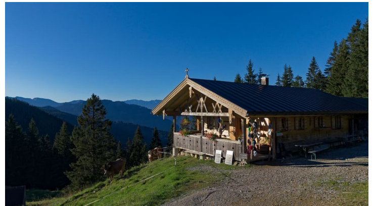
Anton Brey; Anton Brey - Photography, Unbekannt