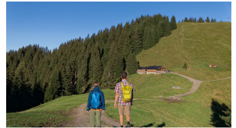
Wandern zur Hörnle-Alm