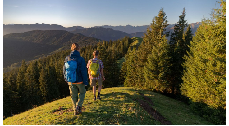
Wanderer Hinteres Hörnle Richtung Stierkopf