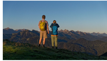
Ausblick vom Stierkopf - © Anton Brey, Ammergauer Alpen GmbH