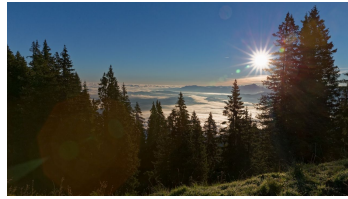
Ausblick vom Stierkopf - © Anton Brey, Ammergauer Alpen GmbH