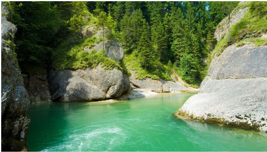
Fernwanderweg Meditationsweg Ammergauer Alpen - Scheibum