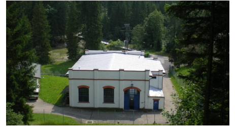
Kraftwerk Kammerl - © Thorsten Unseld, Horst Preisenhammer