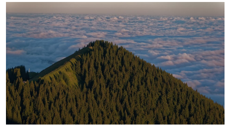
Hinteres Hörnle