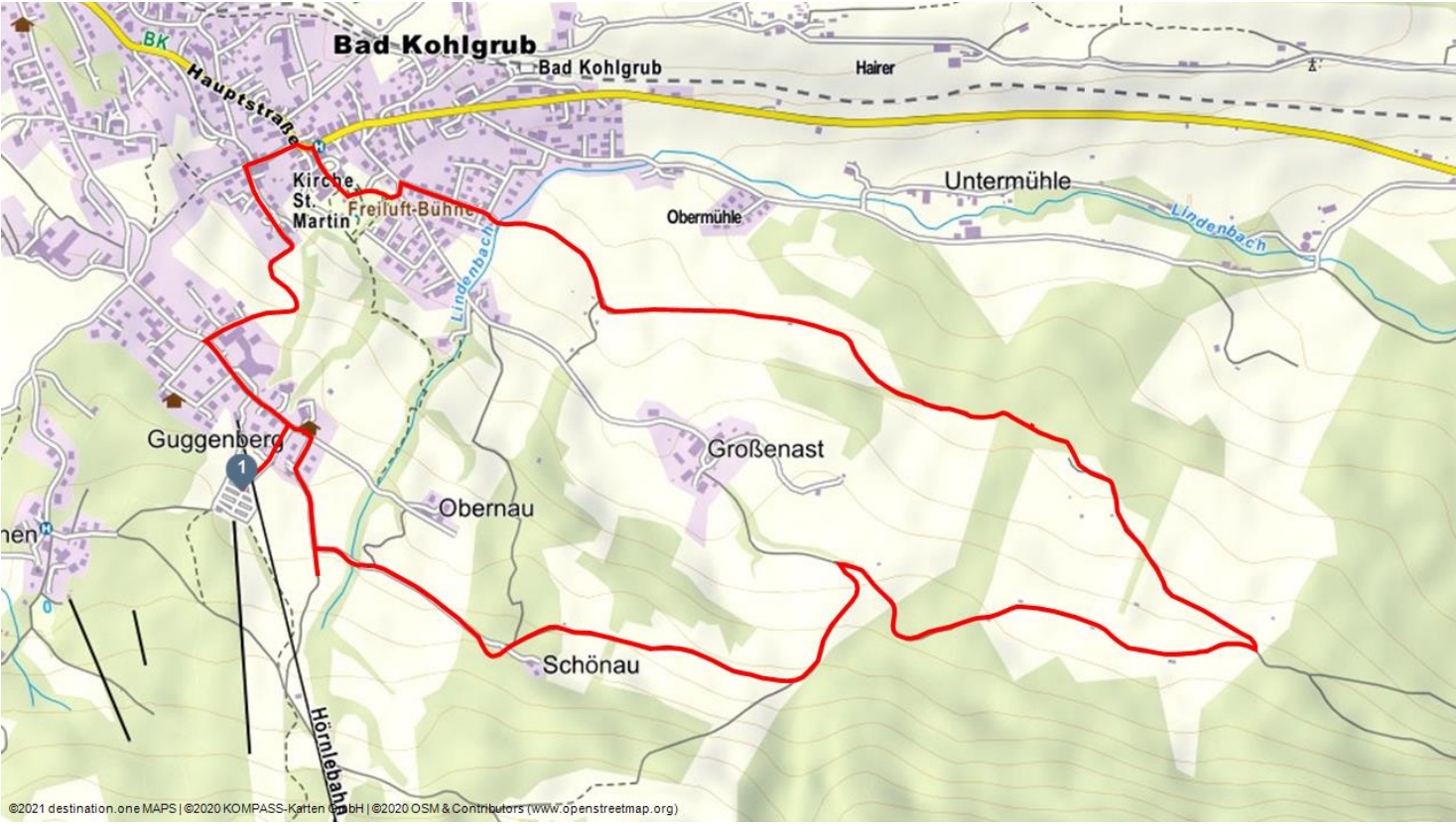
©2021 destination.one MAPS | ©2020 KOMPASS-Karten GmbH | ©2020 OSM & Contributors (www.openstreetmap.org)