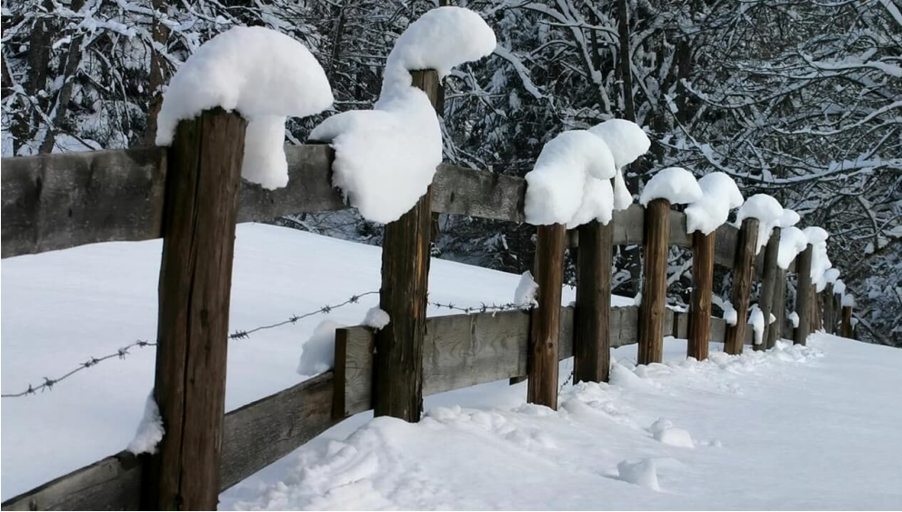
Winterwanderung - Geizenmoos - © Thorsten Unseld, Ammergauer Alpen GmbH