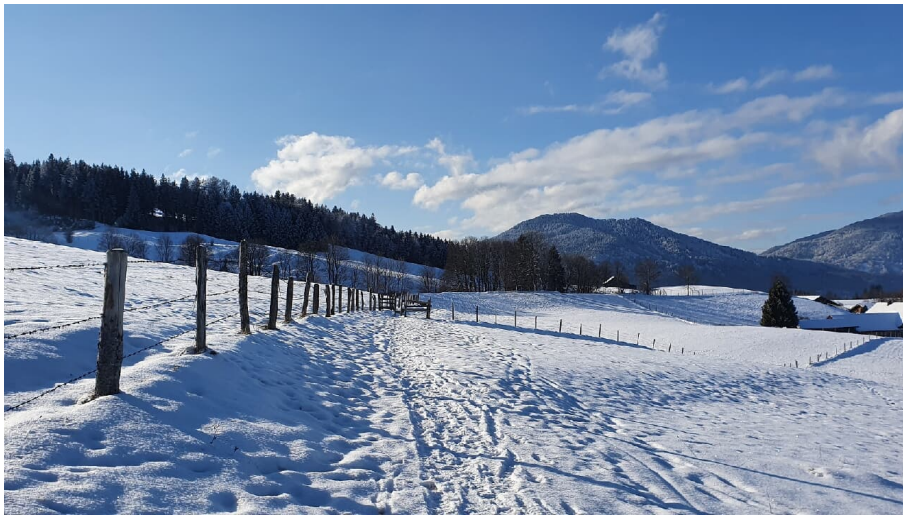
Winterwanderweg Kraggenau