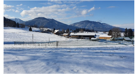
Winterwanderweg Kraggenau