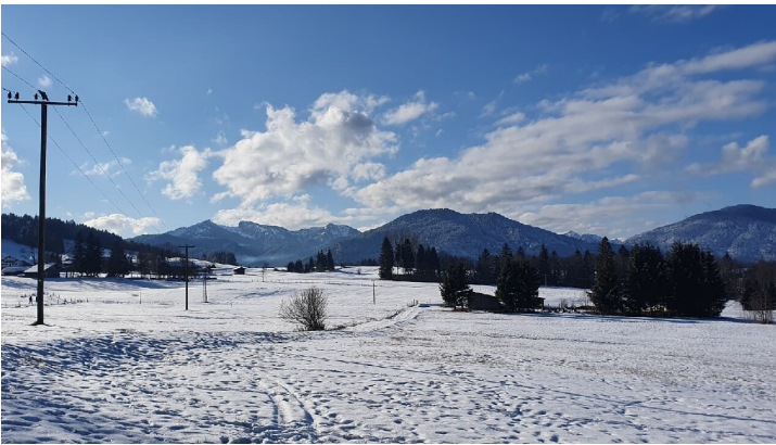
Winterwanderweg Kraggenau mit Blick auf Teufelstättkopf