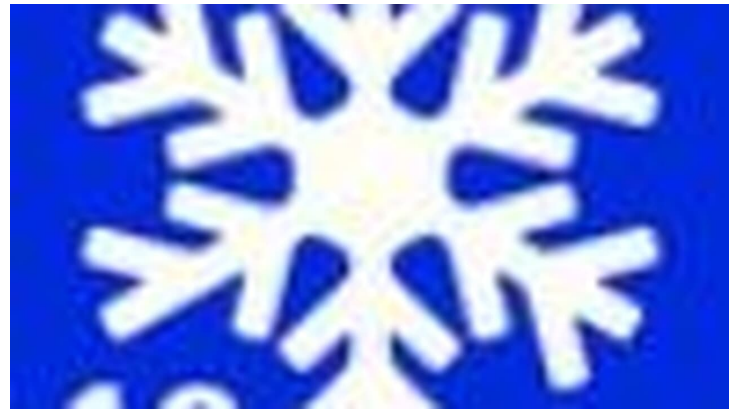
Winterwanderweg 10 Kraggenauer Runde