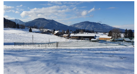
Winterwanderweg Kraggenau