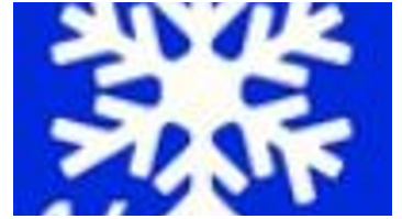
Winterwanderweg 14 Rochusfeld