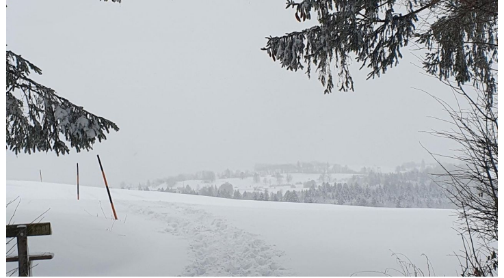
Hinterkehr nach Rochusfeld