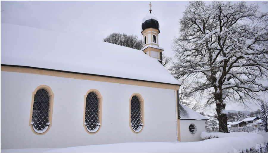
St. Rochus Kirche im Winter