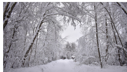
Winterwanderung Rochusfeld