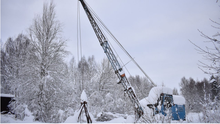
Moorlehrpfad im Winter