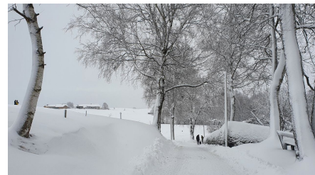
Richtung Rochusfeld