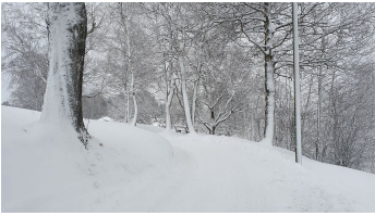
Rochusfeld Richtung Rochuskapelle - © Ammergauer Alpen GmbH