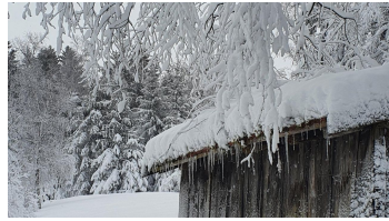
Stadel Rochusfeld