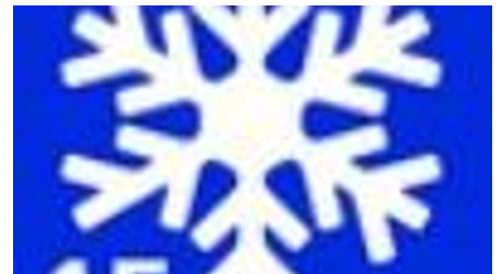
Winterwanderweg 15 Jägerhaus Runde