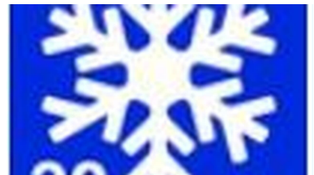
Winterwanderweg 20 Gschwendt Runde