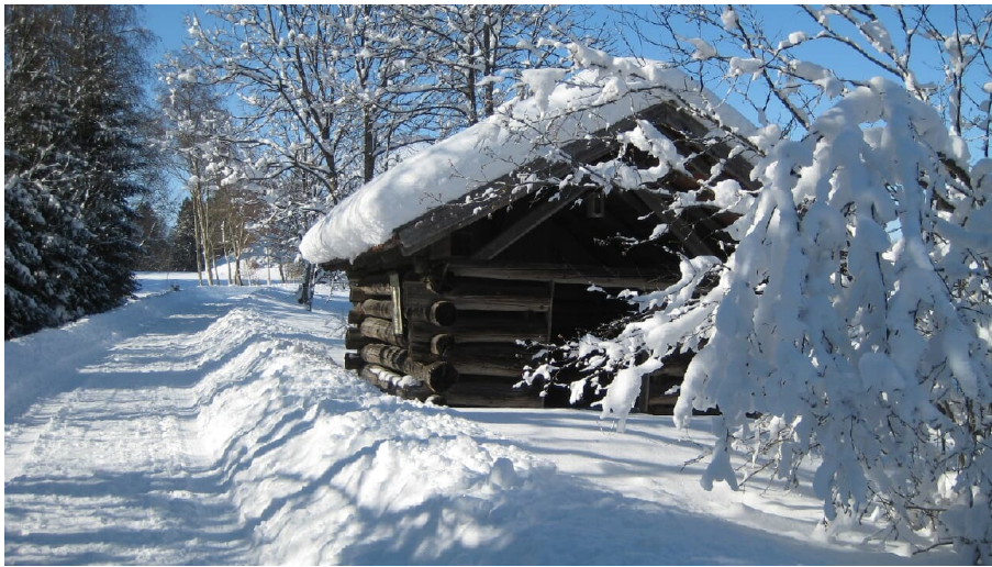
Winterwandern in Bad Bayersoien - © Martin Maier, Ammergauer Alpen GmbH