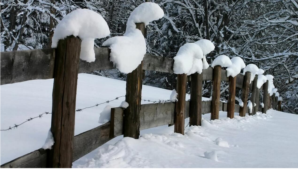
Winterwanderung - Geizenmoos