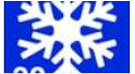
Winterwanderweg 20 Gschwendt Runde