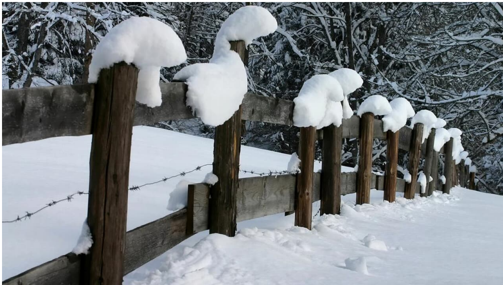
Winterwanderung - Geizenmoos