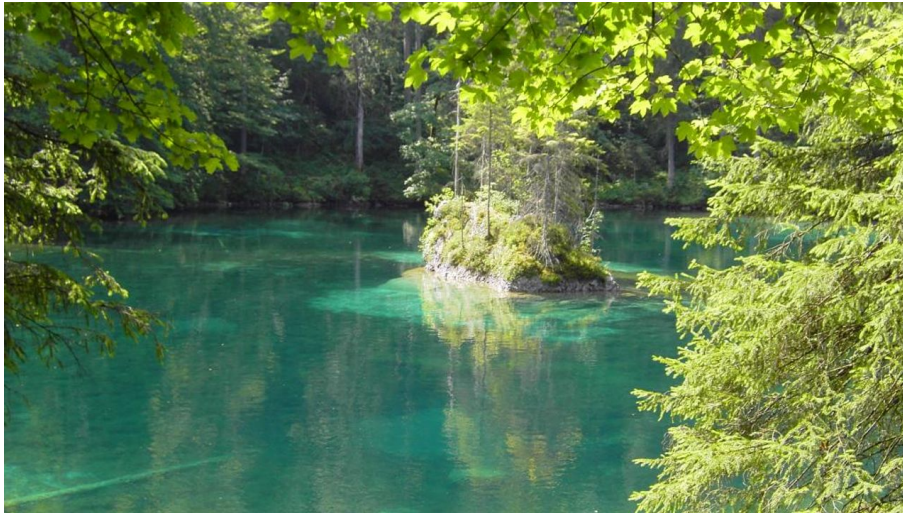
Ferienregion ZugspitzLand, Tourist-Information Grainau