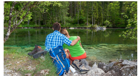
Ferienregion ZugspitzLand, Tourist-Information Grainau