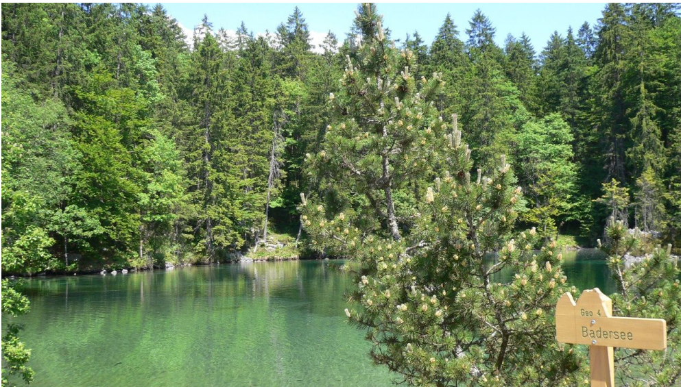
Ferienregion ZugspitzLand, Tourist-Information Grainau

Familienfreundlich, Einkehrmöglichkeit, Rundweg