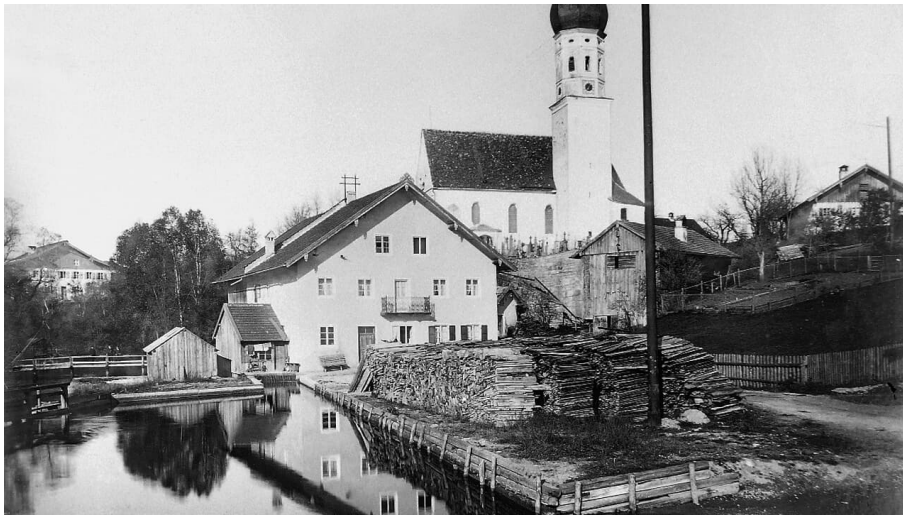
Die Aumühle in Uffing um 1900