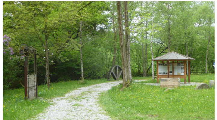
Infopunkt am Mühlenweg bei Uffing