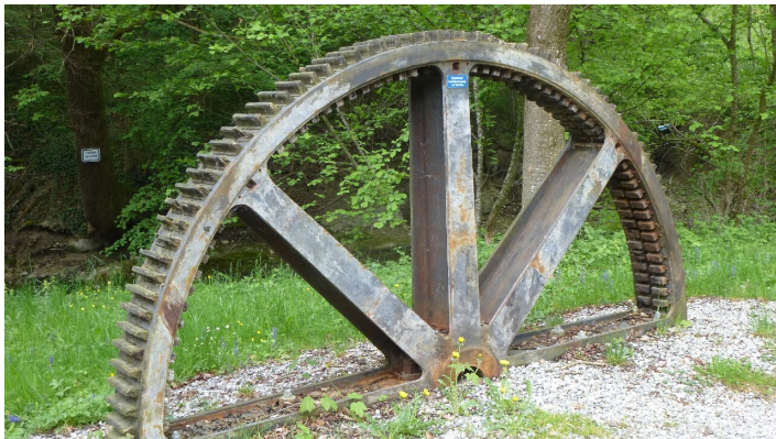
Kammrad am Uffinger Mühlenweg