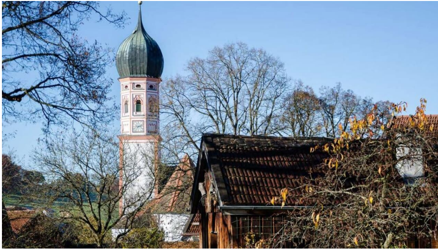
Themenweg - Mühlenweg - Blick auf die Kirche St. Agatha - © Das Blaue Land