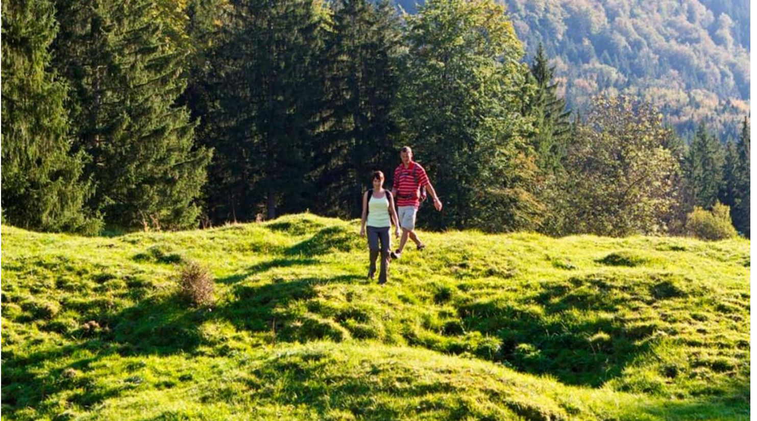
Wanderung - Boschet-Rundweg - Wandern in Ohlstadt