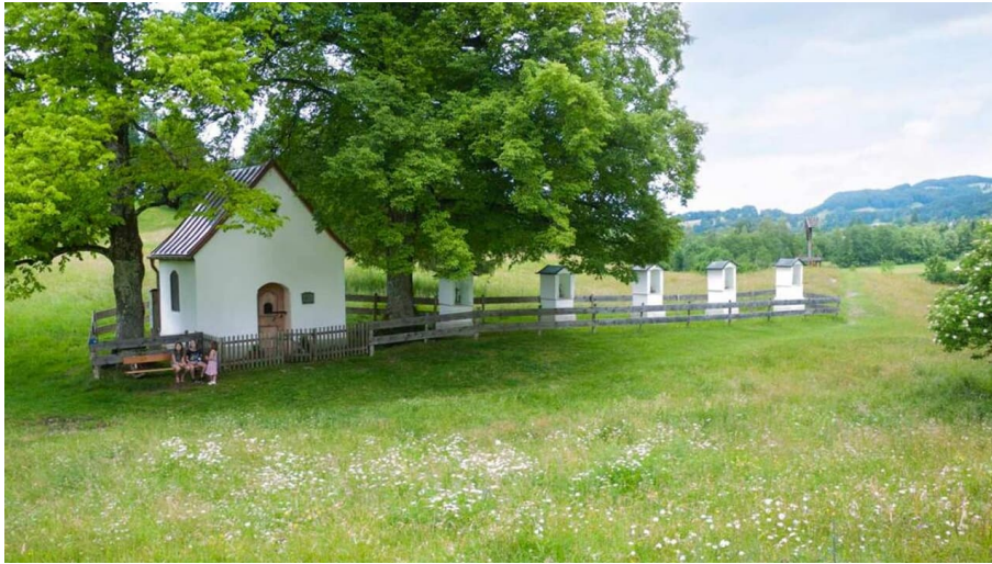
Wanderung - Boschet-Rundweg - Die Boschetkapelle - © Das Blaue Land