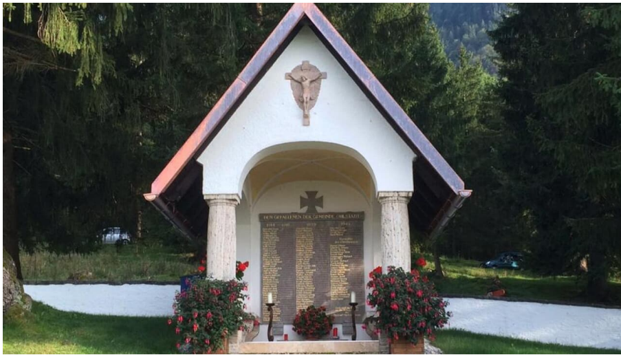
Wanderung Ramm-Kriegerdenkmal - Das Kriegerdenkmal in Ohlstadt