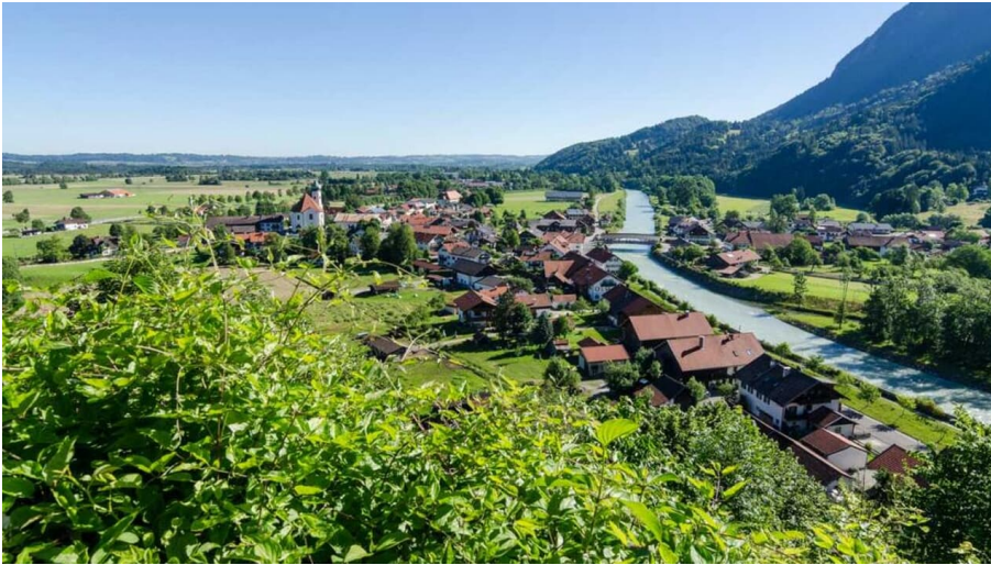
Wanderung - Eschenlohe über den Heuberg - Blick über Eschenlohe Richtung Ohlstadt