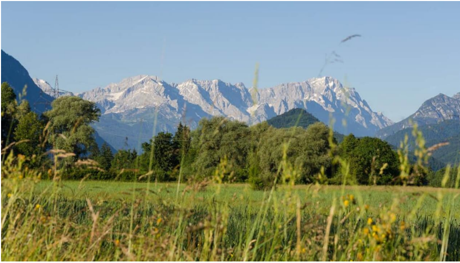
Wanderung - Nach Eschenlohe über Buchenried - Blick ins Wettersteingebirge