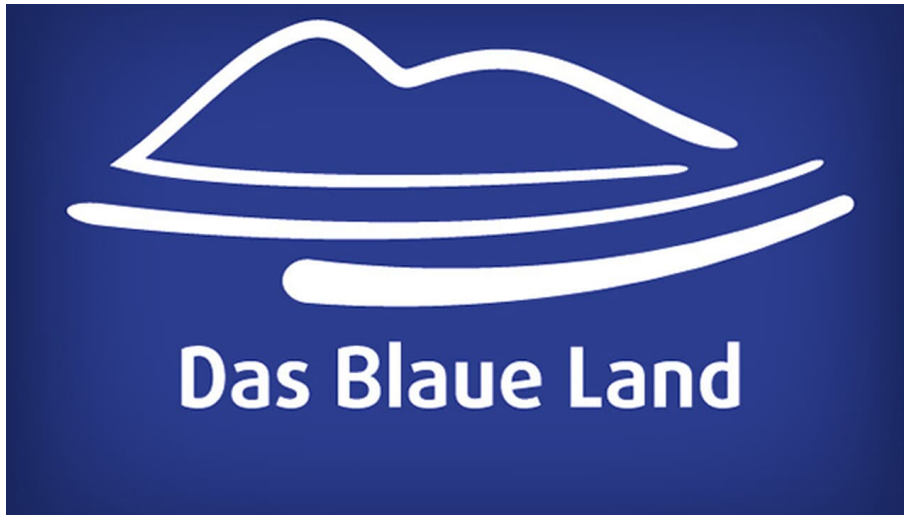
Das Blaue Land