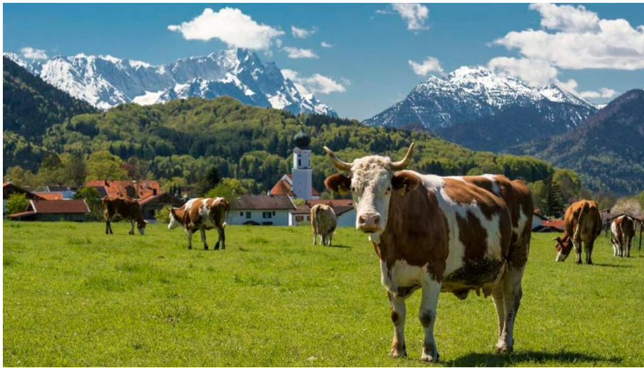
Wanderung - Zum Ohlstädter Wasserfall - Panoramablick auf Ohlstadt und die Zugspitze