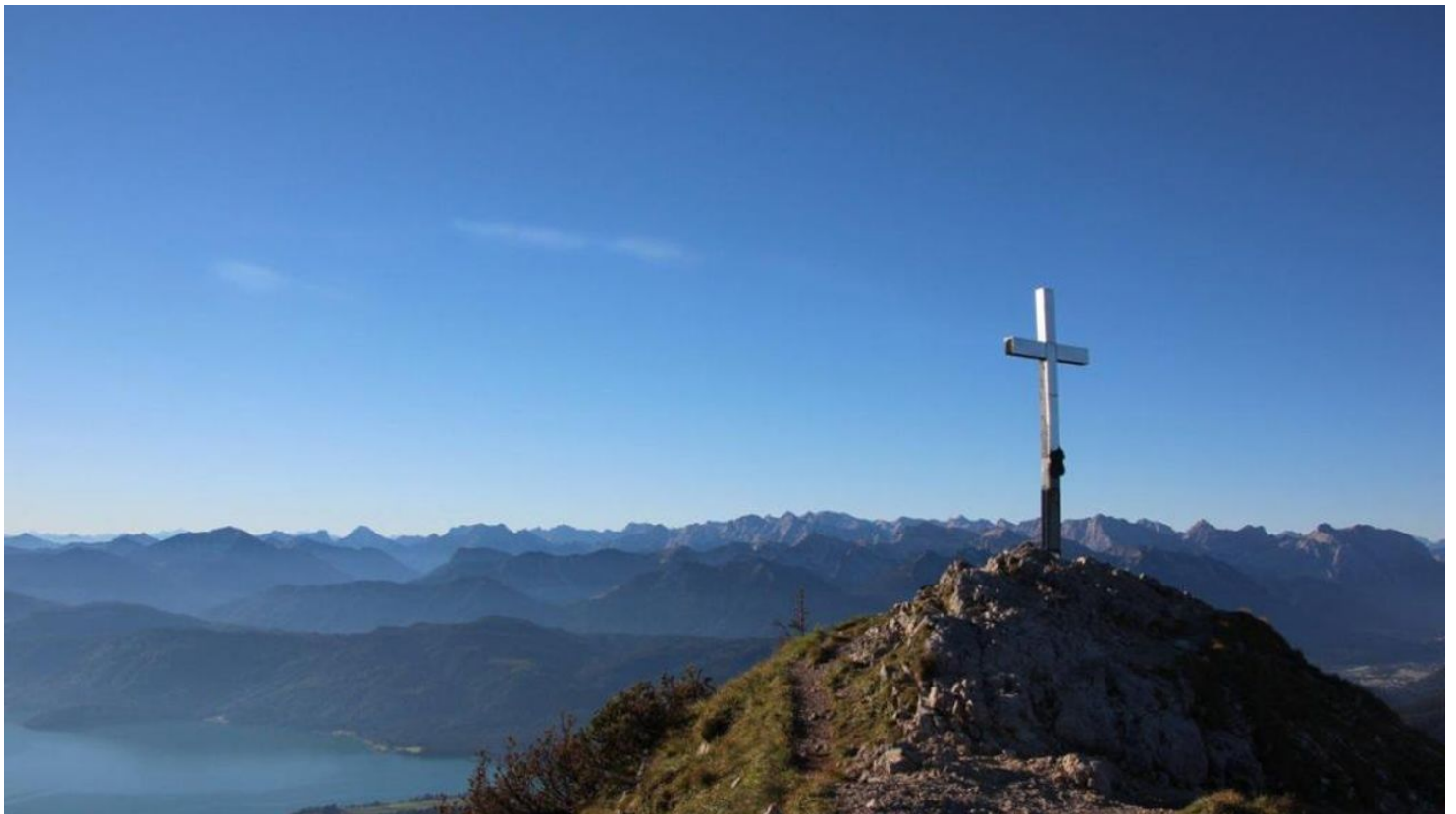
Wanderung - Gratwanderung vom Heimgarten zum Herzogstand - Blick vom Heimgarten