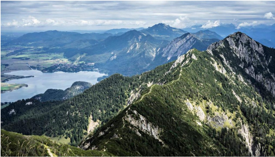
Bergtour - Gratwanderung vom Heimgarten zum Herzogstand