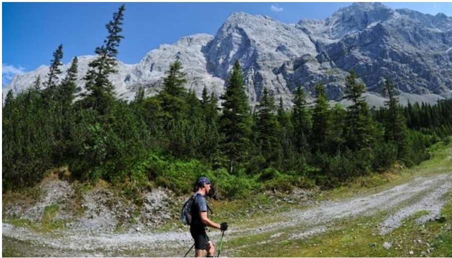
Trailrunning von Garmisch-Partenkirchen nach Ehrwald