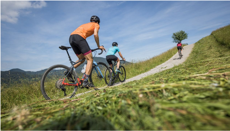
Gravelbiken im Naturpark