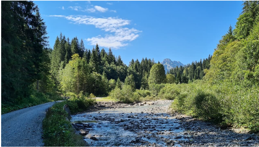
Durchs Halbammertal