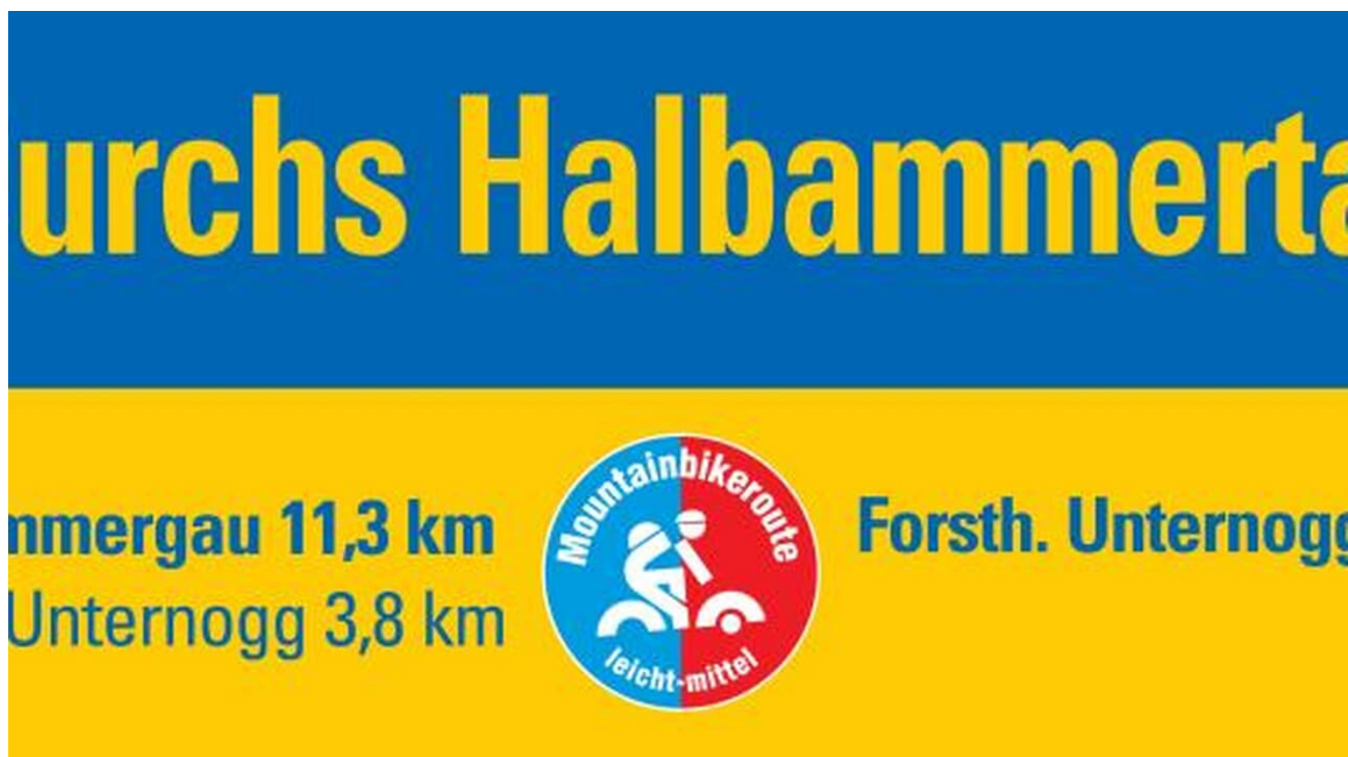
Beschilderung Mountainbiketour Durchs Halbammertal

Prospektmaterial ansehen und/oder bestellen