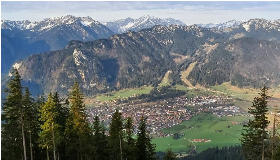
Aufacker Blick auf Oberammergau