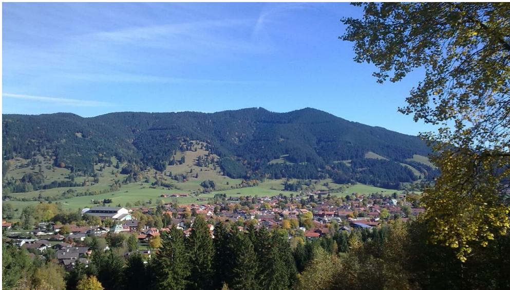
Blick auf Aufacker von der Kreuzigungsgruppe