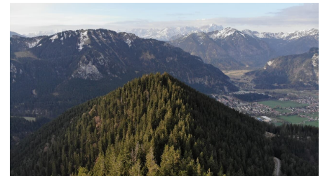
Luftaufnahme Aufacker