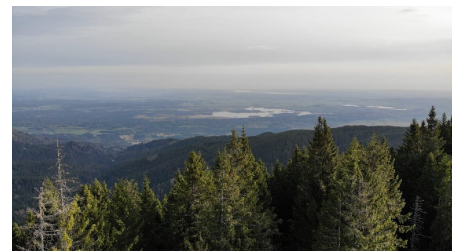
Blick vom Aufacker Richtung Staffelsee