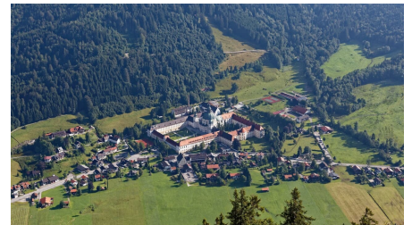
Blick vom Ochsensitz auf Ettal