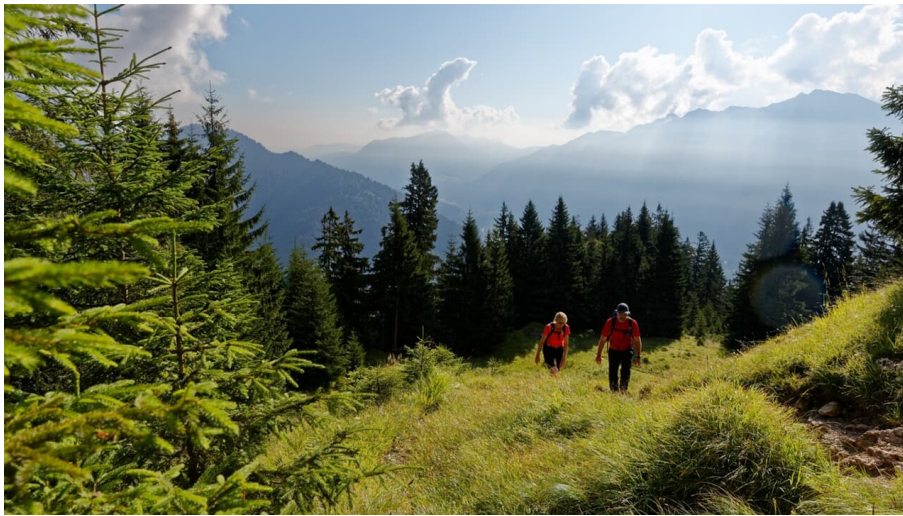
Aufstiegsroute über den Ochsenitz und Ziegelspitze