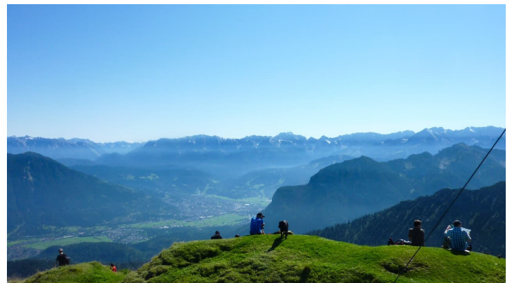
Gipfelpanorama auf der Notkarspitze