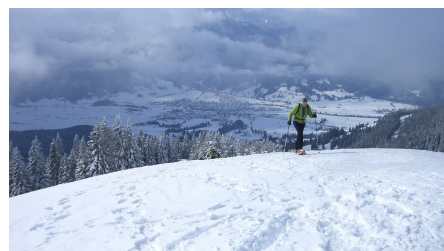
Schneeschuhwanderung Stierkopf

Logo- Skibergsteigen umweltfreundlich