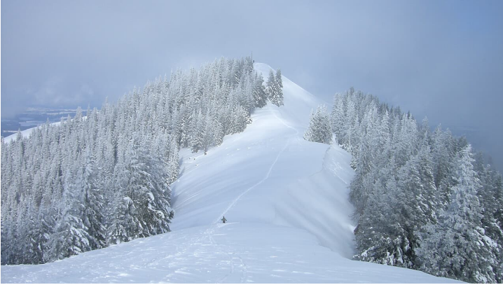
Schneeschuhwanderung Stierkopf