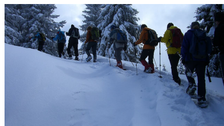
Schneeschuhwanderung Stierkopf