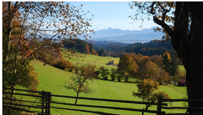
Radtour Murnau Bad Bayersoien - Blick von Bad Kohlgrub