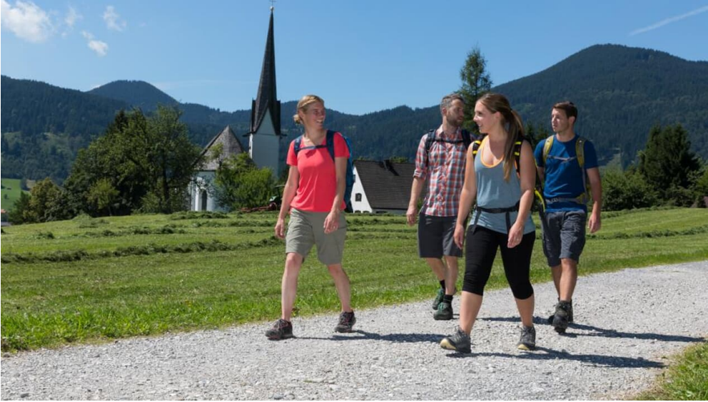
Meditationsweg Ammergauer Alpen - an der Kappl - © Thorsten Unseld, Anton Brey