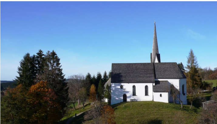
Fernwanderweg Meditationsweg Ammergauer Alpen