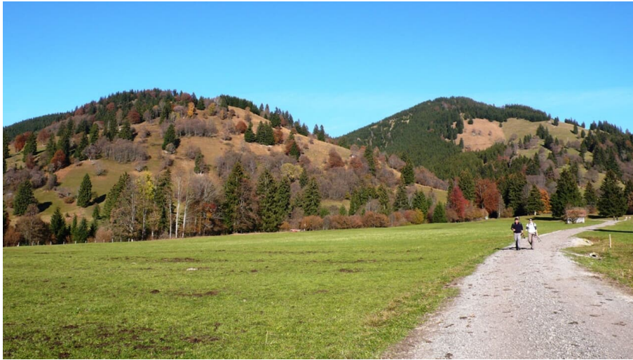
Fernwanderweg Meditationsweg Ammergauer Alpen