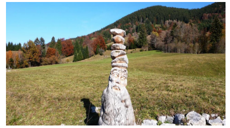
Fernwanderweg Meditationsweg Ammergauer Alpen