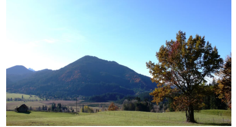
Fernwanderweg Meditationsweg Ammergauer Alpen