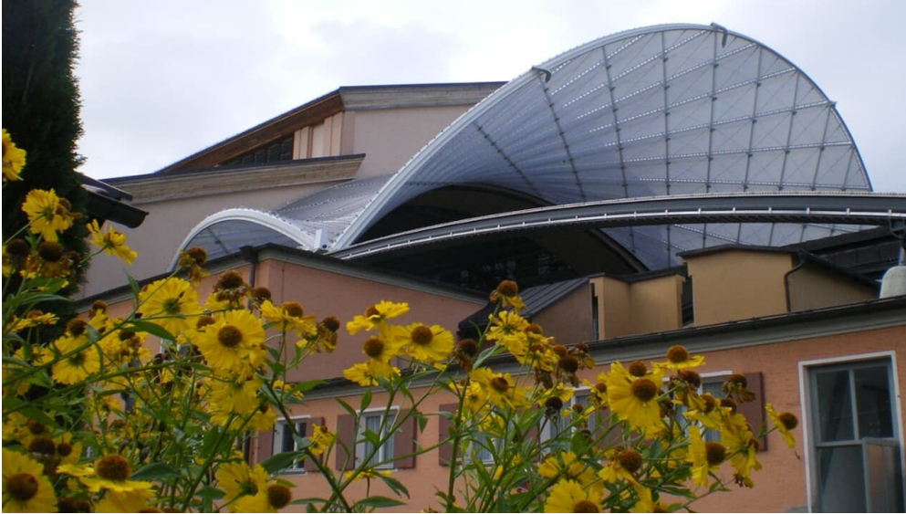
Fernwanderweg Meditationsweg Ammergauer Alpen - Passionstheater - © Thorsten Unsel, Ammergauer Alpen GmbH