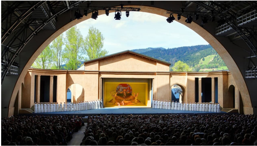
Fernwanderweg Meditationsweg Ammergauer Alpen - Bühne des Passionstheaters