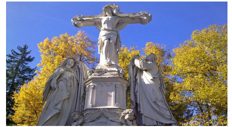
Fernwanderweg Meditationsweg Ammergauer Alpen - Kreuzigungsgruppe - © Thorsten Unsel, Nicole Richter