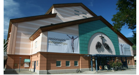
Fernwanderweg Meditationsweg Ammergauer Alpen - Passionstheater - © Thorsten Unsel, Ammergauer Alpen GmbH