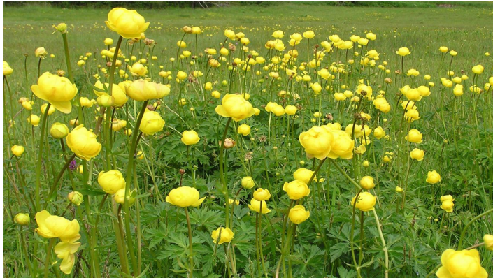
Wanderung - Durch das Weidmoos - Dotterblumen