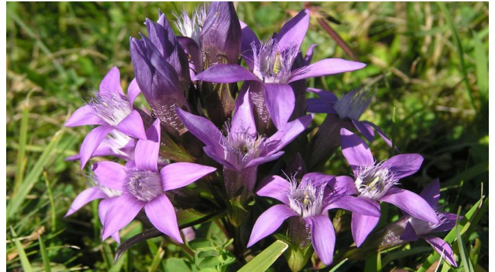
Wanderung - Durch das Weidmoos - Orchideen