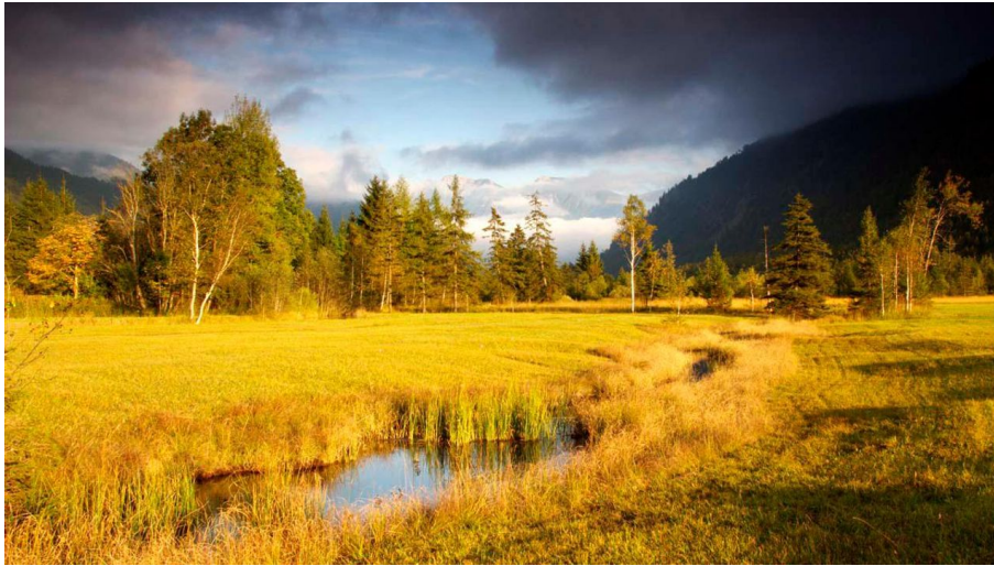
Wanderung durchs Weidmoos