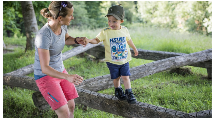
Spielen Bad Kohlgrub