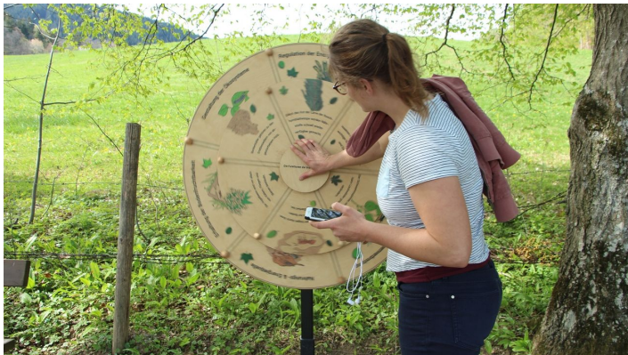
Station auf dem Timberlandtrail