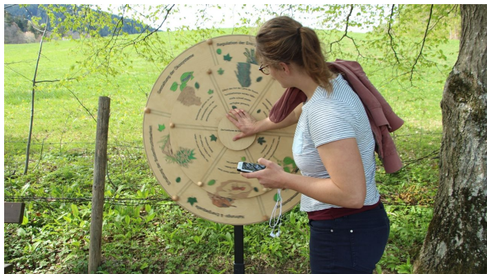
Station auf dem Timberlandtrail