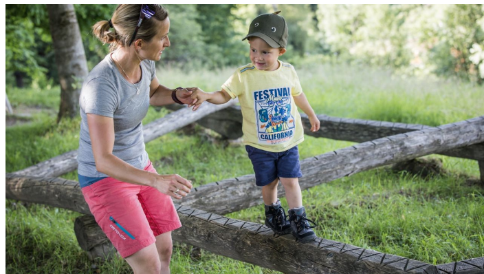
Spielen Bad Kohlgrub