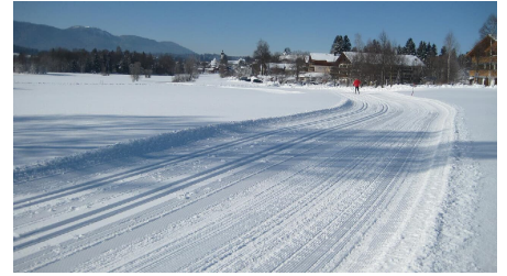
Langlaufloipe Seenrunde - Soier See