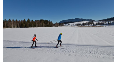
Langlaufloipe Seenrunde