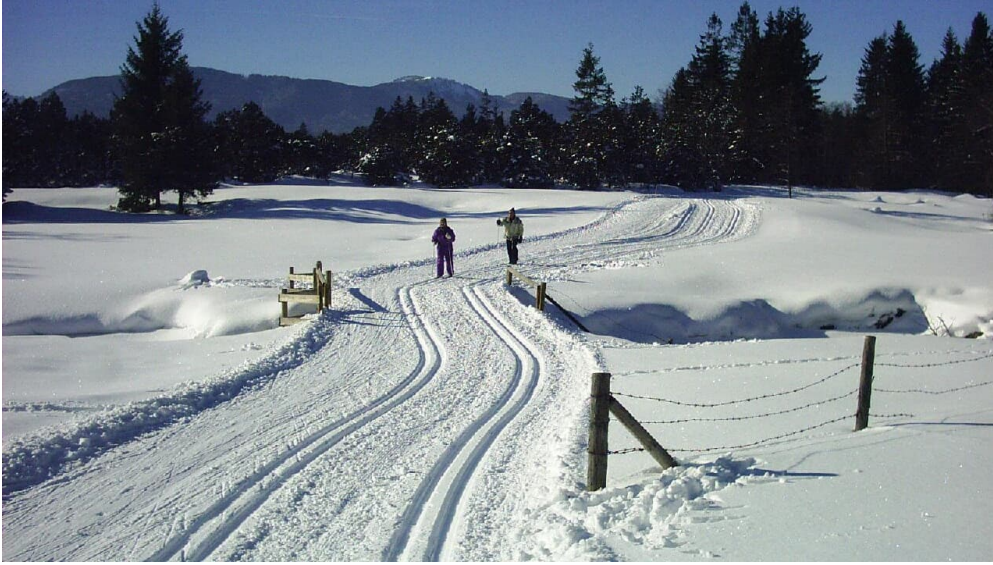
Langlaufloipe Seenrunde