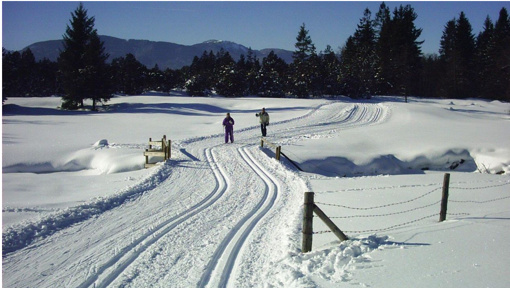
Langlaufloipe Seenrunde