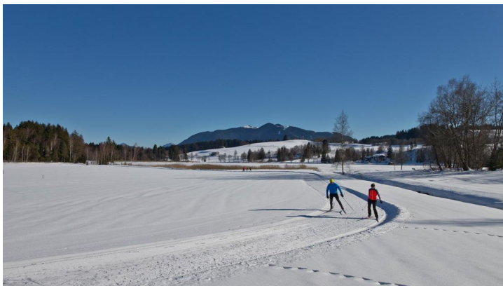
Langlaufloipe Seenrunde