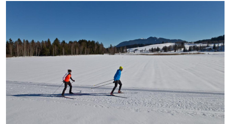
Langlaufloipe Seenrunde