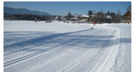
Langlaufloipe Seenrunde - Soier See