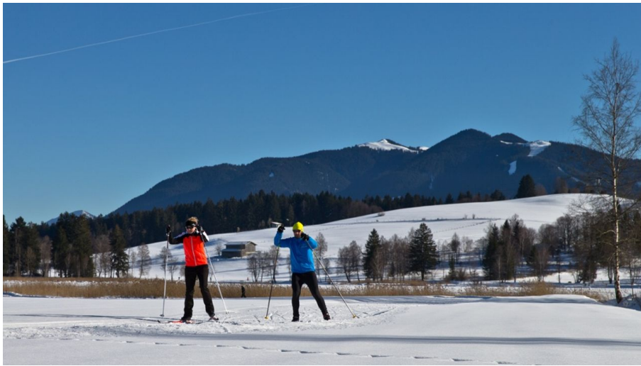
Langlaufloipe Seerunde